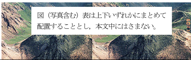
図(写真含む)表は上下いずれかにまとめて配置することとし、本文中にははさまない。