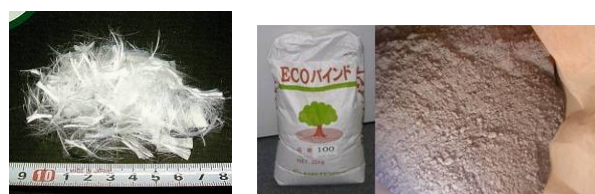
図-3 補強短繊維（左）・接合剤（右）