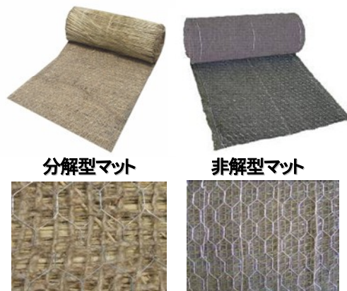
図-2 土壌侵食防止マット

従来の植生工に期待される早期生育植物による表面侵食防止効果を土壌侵食防止マットで代用しながら，森林土壌に近い質な植生基盤を導入することで，荒廃地において目標とする植物群落への植生回復を安定して図ることが可能です。導入直後より耐侵食効果が期待でき植生基盤を中・長期的に安定維持することができるため，外来生物による早期緑化を必要としません（外来生物規制法対応）。成長の遅い在来種のための播種や無播種による郷土種の侵入が可能です。