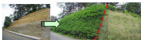
施工前 施工後1年11ヶ月*