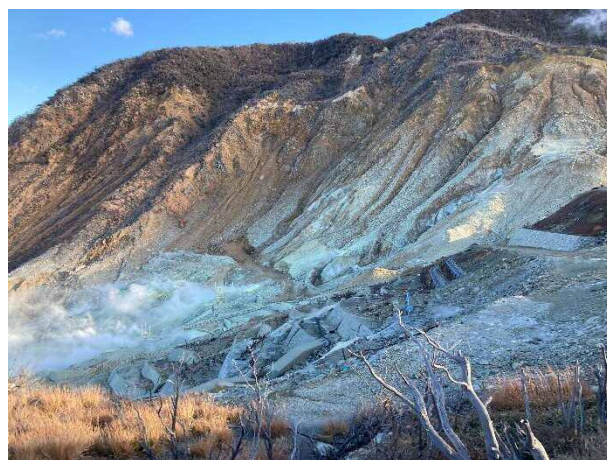
写真⑥ 大涌沢 地すべり対策事業