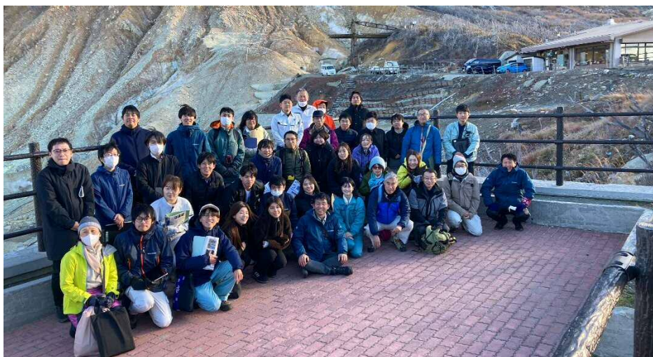
参加者集合写真（大涌谷にて）