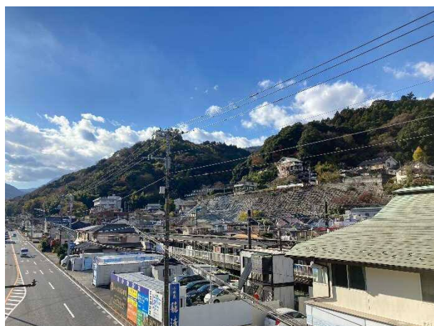
写真③ 入生田地区 急傾斜地崩壊対策事業