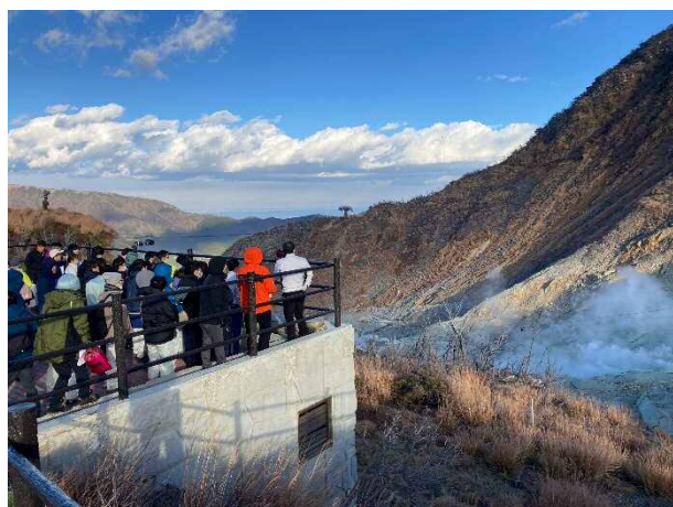
写真⑤ 大涌沢 地すべり対策事業