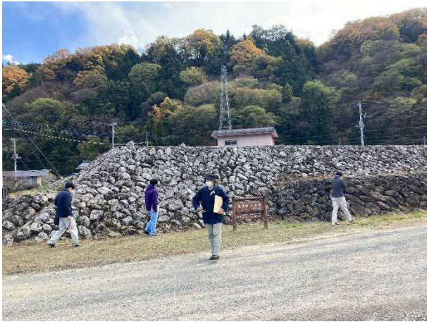
写真③ 石積出二番堤