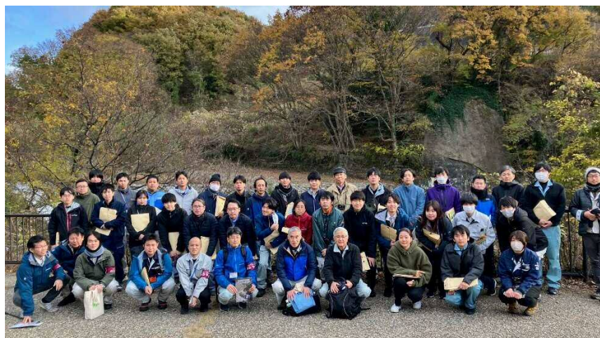
参加者集合写真（勝沼堰堤にて）