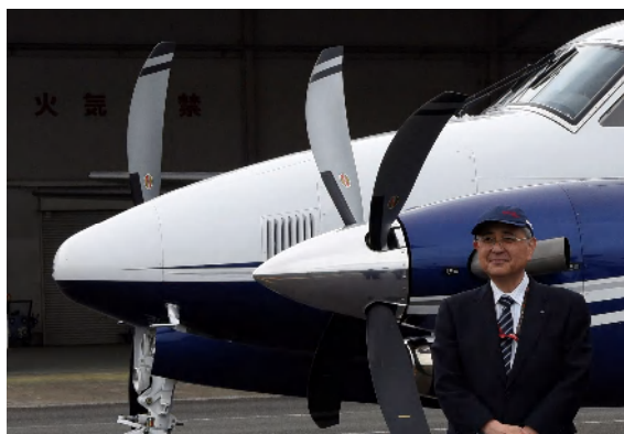
大阪の八尾空港にて世界最新鋭 双発機「あおたか」初飛行 (2019年4月15日撮影)