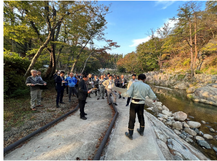
不動尊砂防堰堤河川護岸の見学