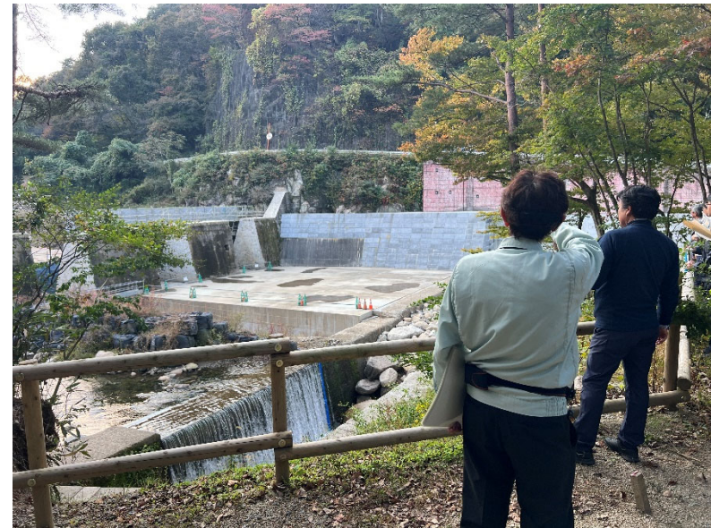
不動尊砂防堰堤の見学