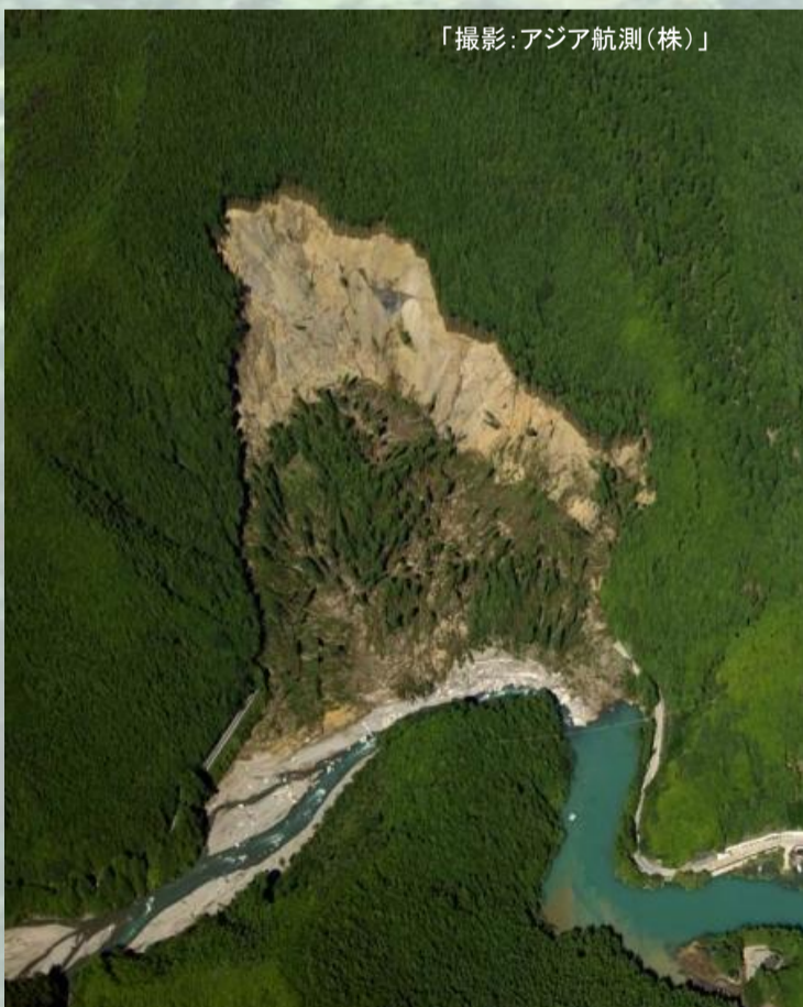
平成23年9月奈良県天川村で発生した深層崩壊