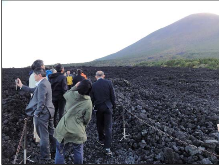
現場見学会 焼走り熔岩流（岩手山）