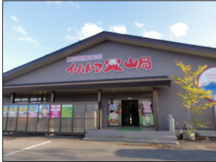
現場見学会 イーハトーブ火山局（岩手県八幡平市）