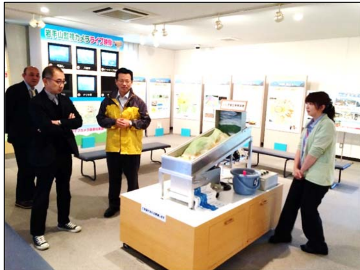
土石流模型実験装置の実演（イーハトーブ火山局）