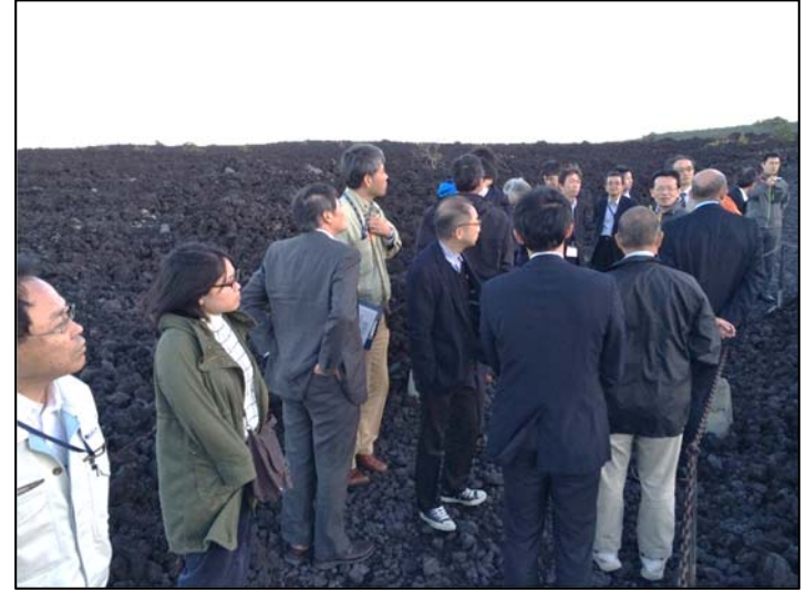
現場見学会 焼走り熔岩流（岩手山）