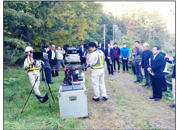
現場見学会 (湯の又砂防堰堤) ローンの実演 (協力: ㈱タックエンジニアリング)