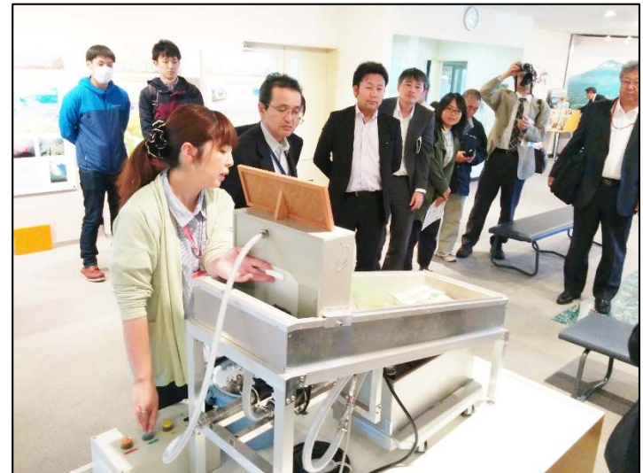
土石流模型実験装置の実演（イーハトーブ火山局）