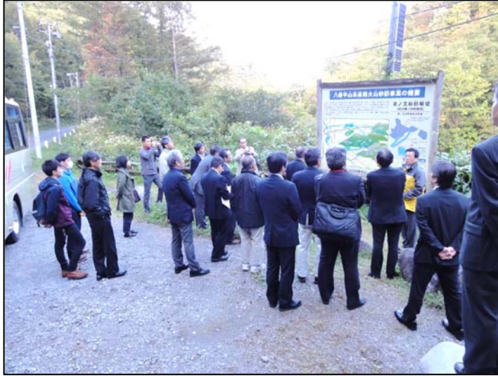
現場見学会 (湯の又砂防堰堤)