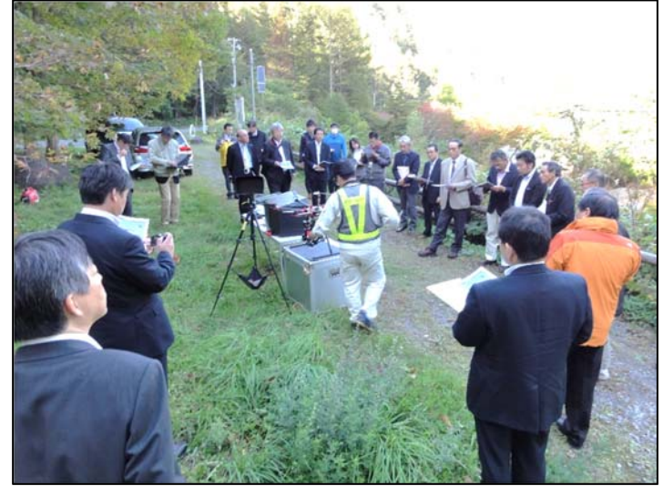
現場見学会 (湯の又砂防堰堤) ドローンの実演 (協力: ㈱タックエンジニアリング)